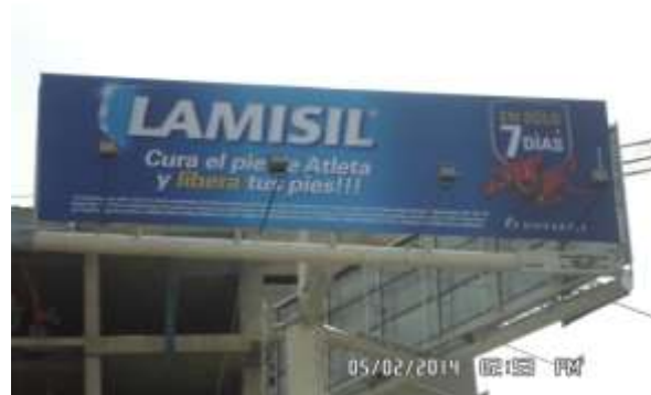
Foto No 2. Texto de la Valla N - S