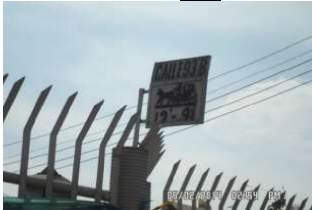
Foto No 3. Dirección de la Valla